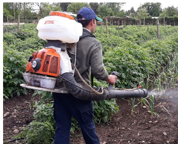
Foto 2. Pulverizador neumático de mochila, conocido comúnmente como "motopulverizadora".

Los pulverizadores hidráulicos de mochila, con accionamiento manual o "bombas de espalda", presentan baja presión de trabajo, normalmente 4 bar (58 PSI) como máximo, lo que limita su uso al control de malezas (herbicidas) y algunos fertilizantes foliares. No es recomendable el uso de estos equipos para el uso de insecticidas, acaricidas y fungicidas en cultivos, más aún si presentan alta densidad de follaje y los plaguicidas actúan por contacto.