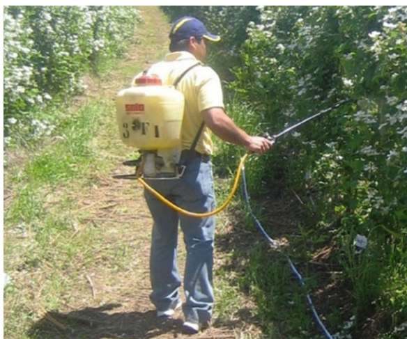
Foto 1. Pulverizador hidráulico de mochila, conocido comúnmente como "bomba de espalda".