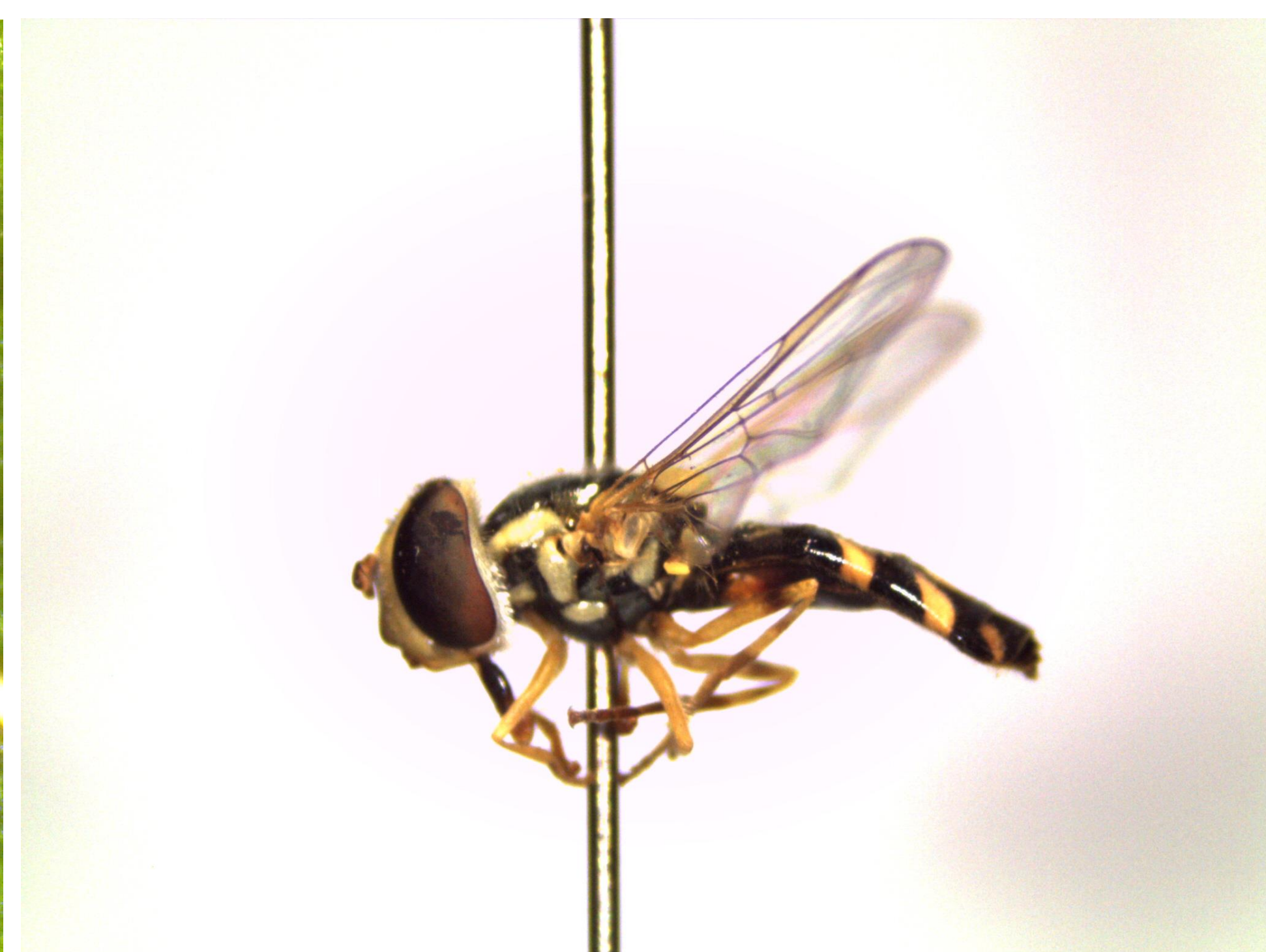
Adulto de moscas de las flores, Allograpta pulchra , sólo se alimenta de néctar de flores