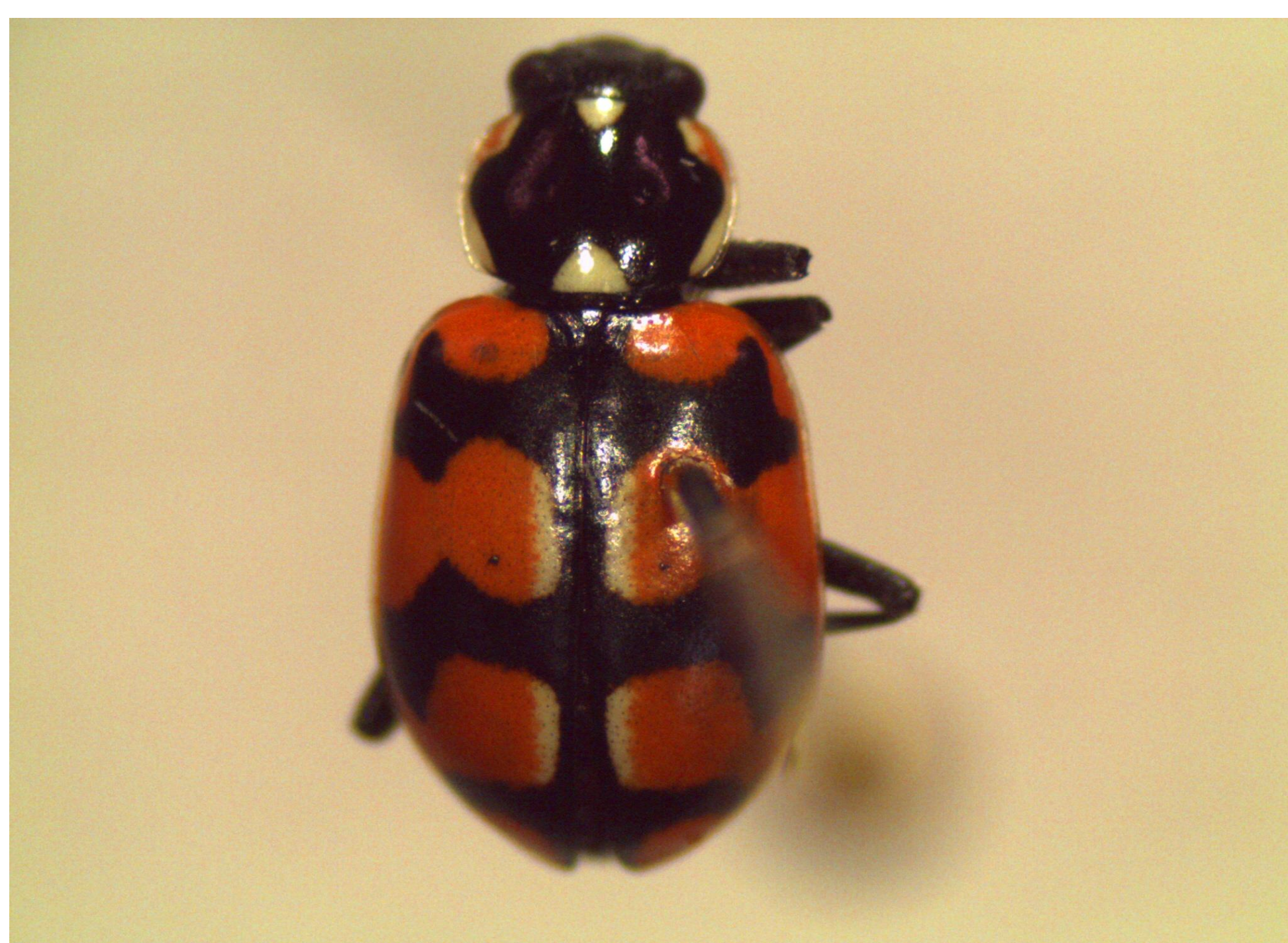
Chinita chilena, Eriopis chilensis , depredador de pulgones