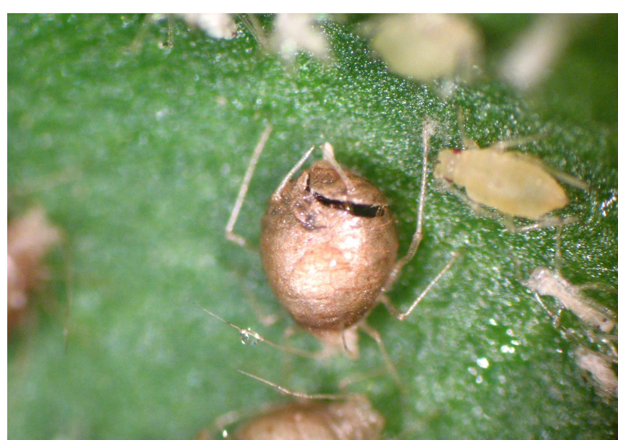
Pulgón parasitado por Aphidius colemani