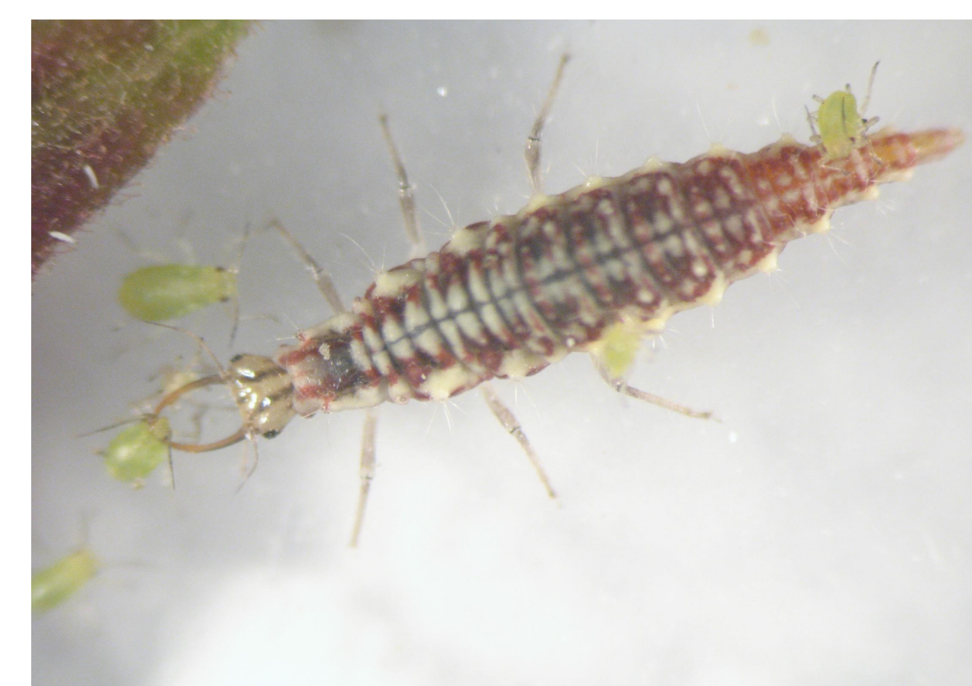
Larva de crisopa, Chrysoperla spp., depredador de pulgones y ninfas de trips de California