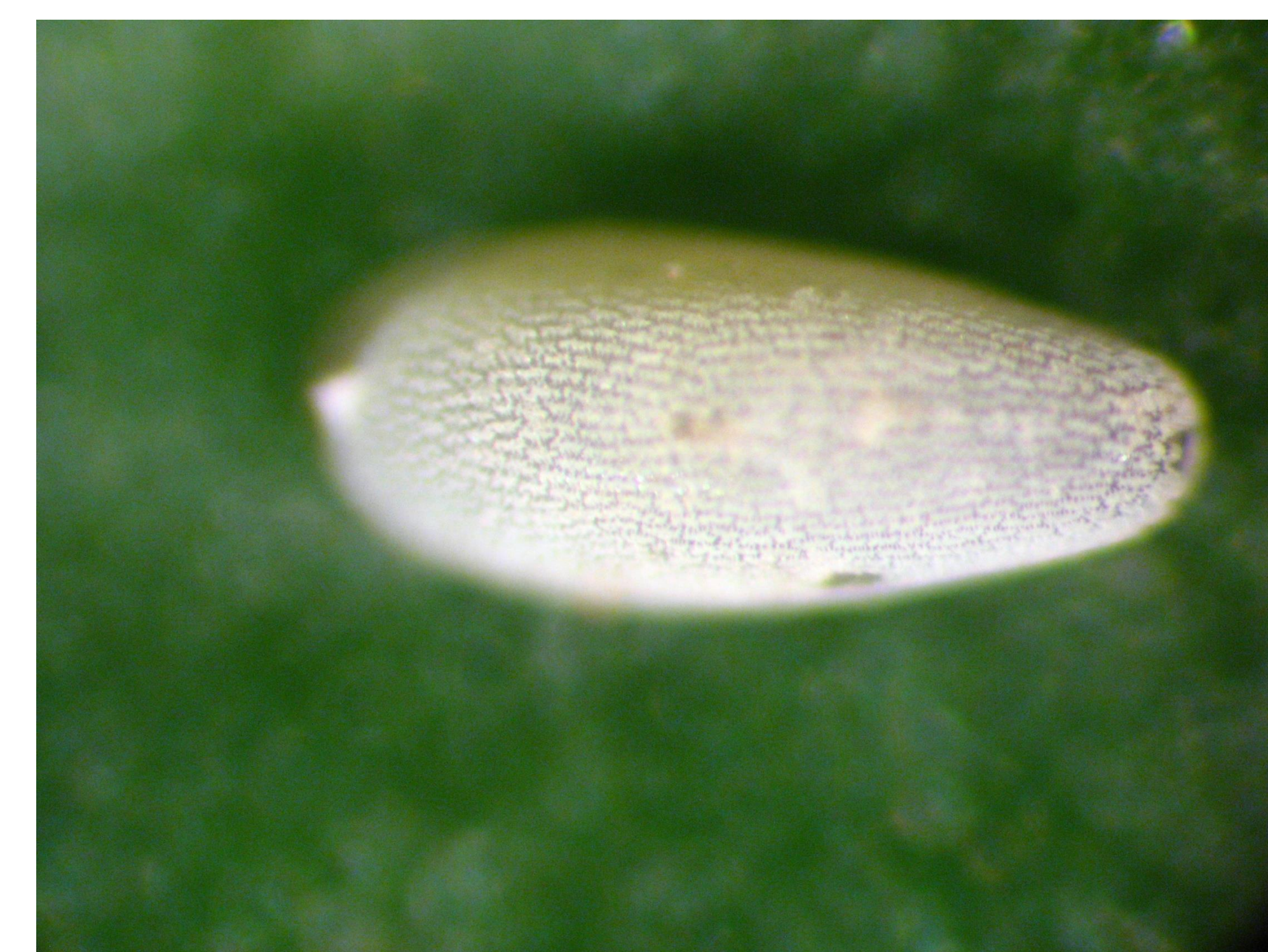
Huevo de moscas de las flores, Allograpta pulchra