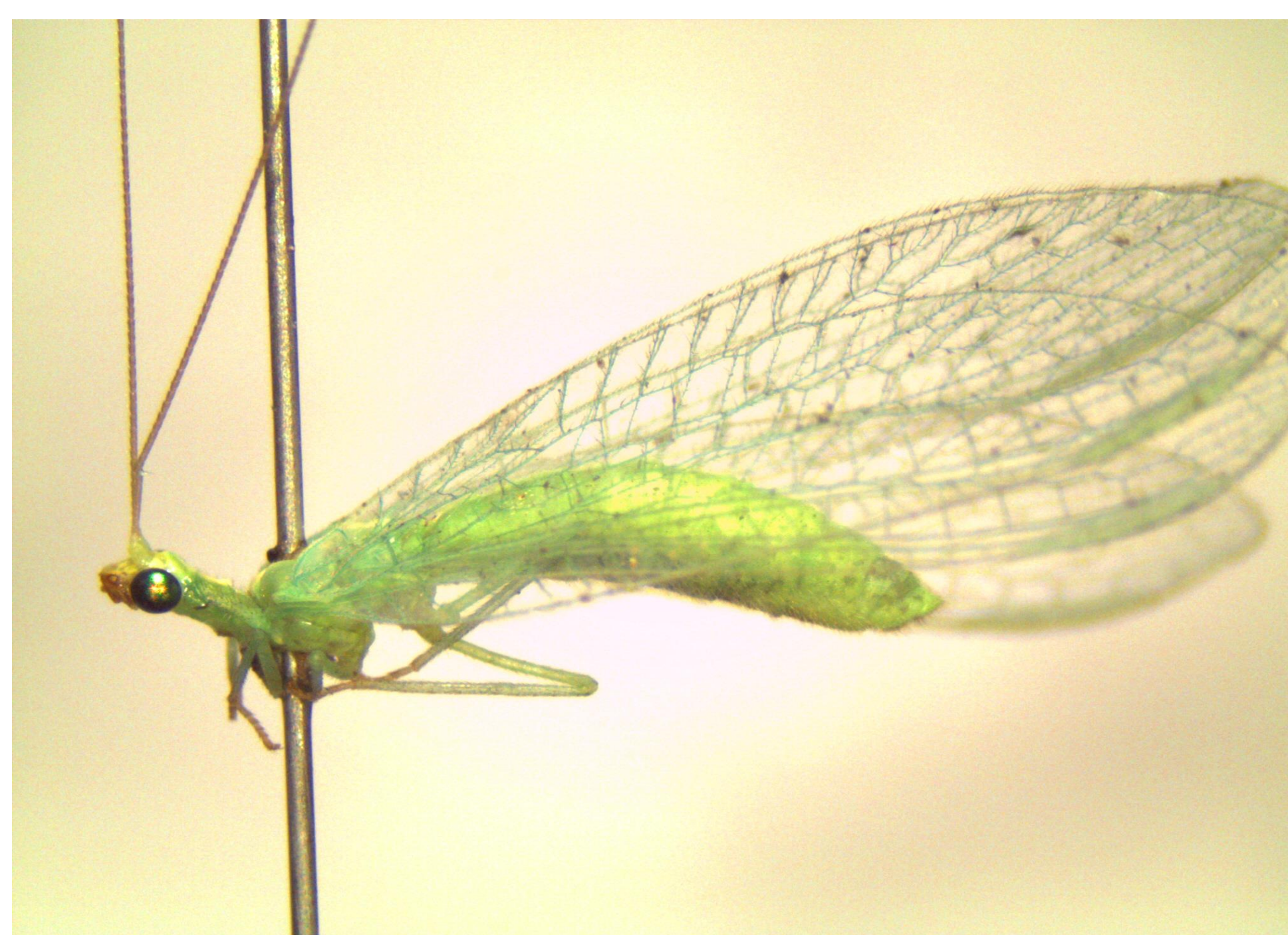
Adulto de crisopa, Chrysoperla spp., depredador de pulgones y ninfas de trips de California