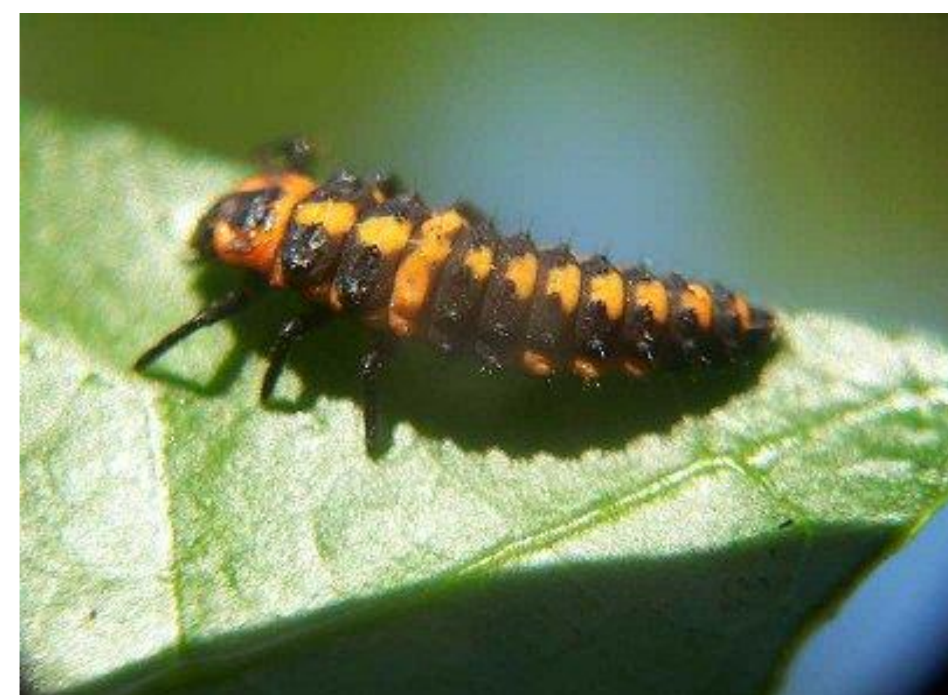
Larva de chinita chilena, Eriopis chilensis , depredador de pulgones