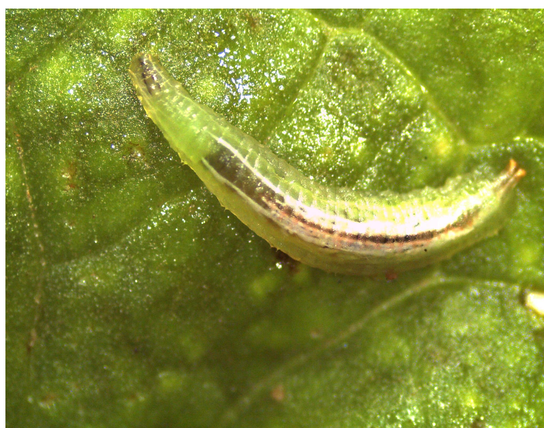
Larva de moscas de las flores, Allograpta pulchra , depredador de pulgones