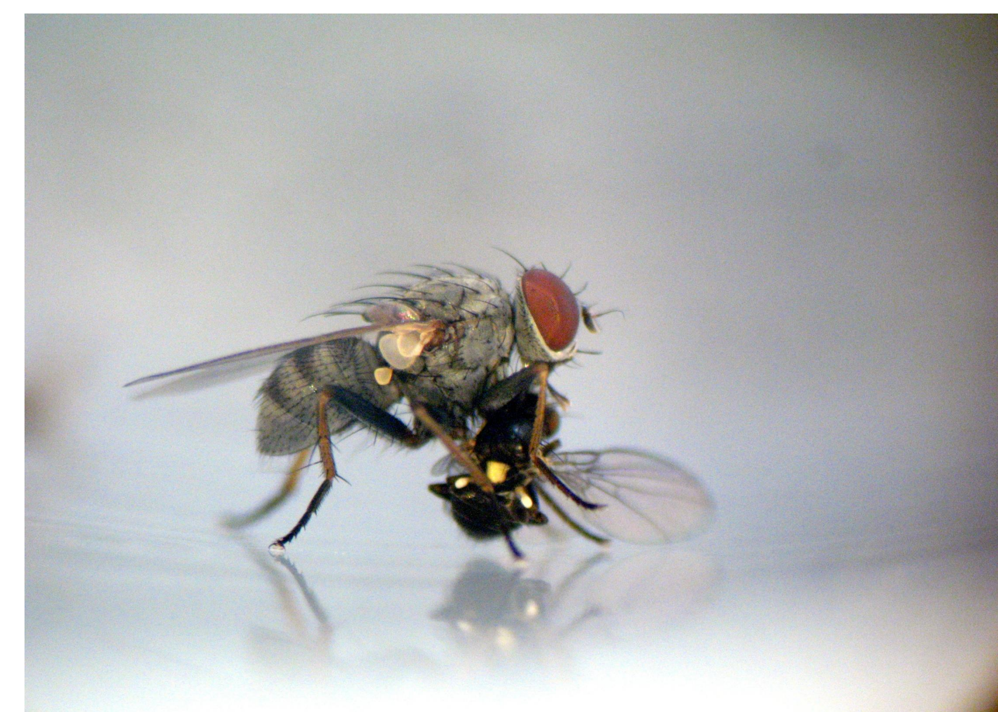
Mosca tigre, Coenisa attenuata , depredador de mosca minadora de las chacras y trips de California