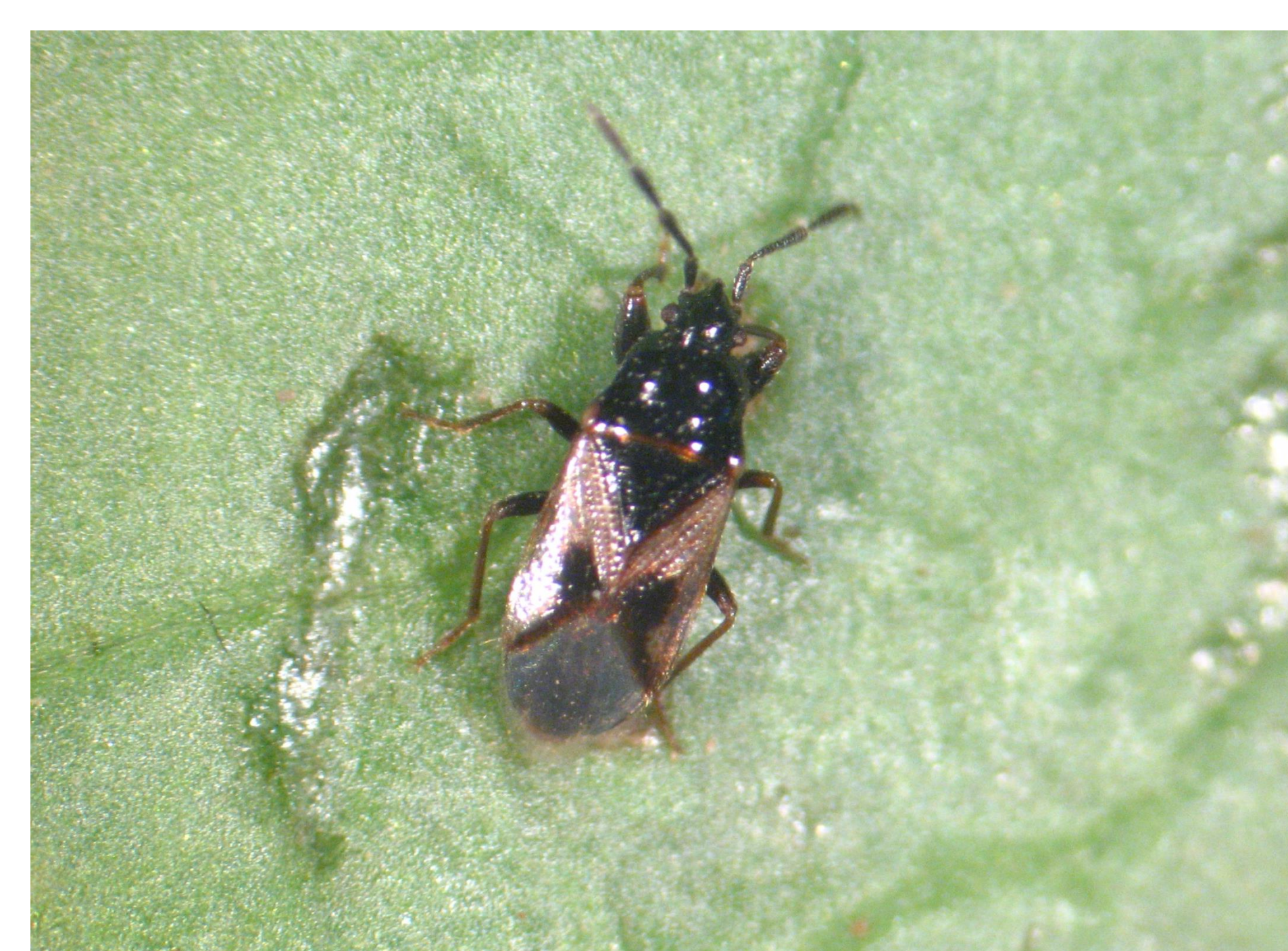
Adulto de chinche pirata, Orius sp., depredador ninfas y adultos de trips de California