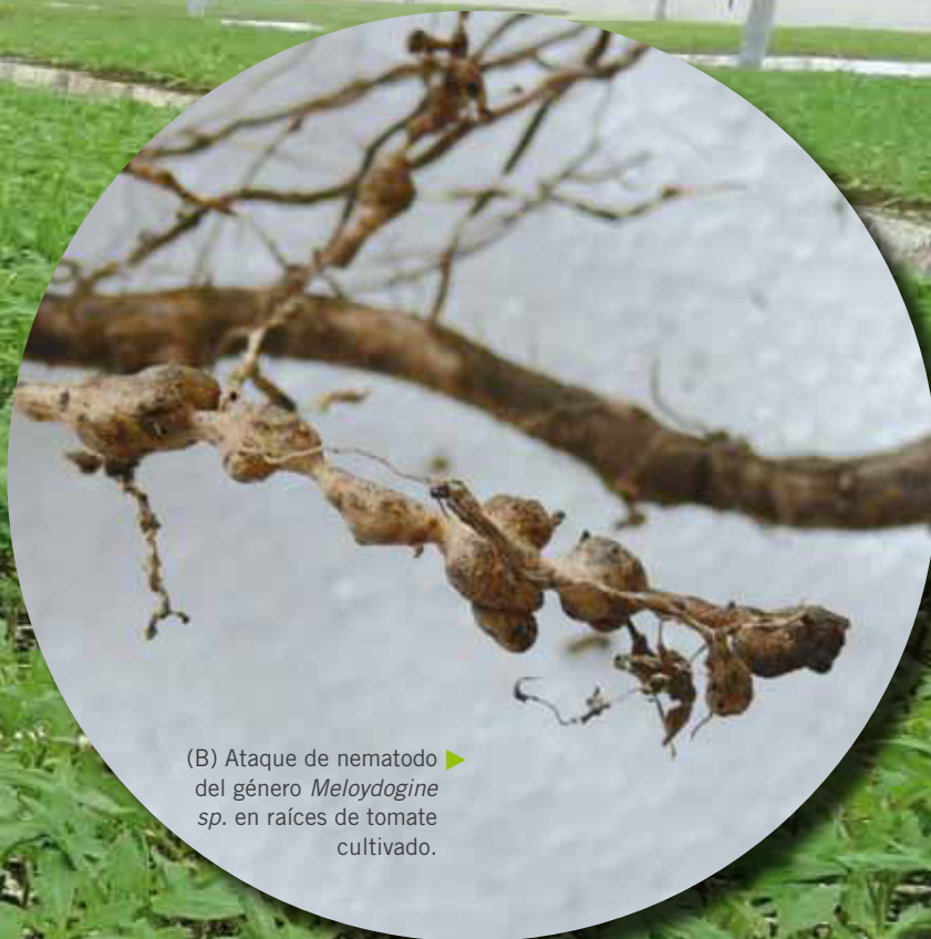
(B) Ataque de nematodo del género Meloidogine sp. en raíces de tomate cultivado.