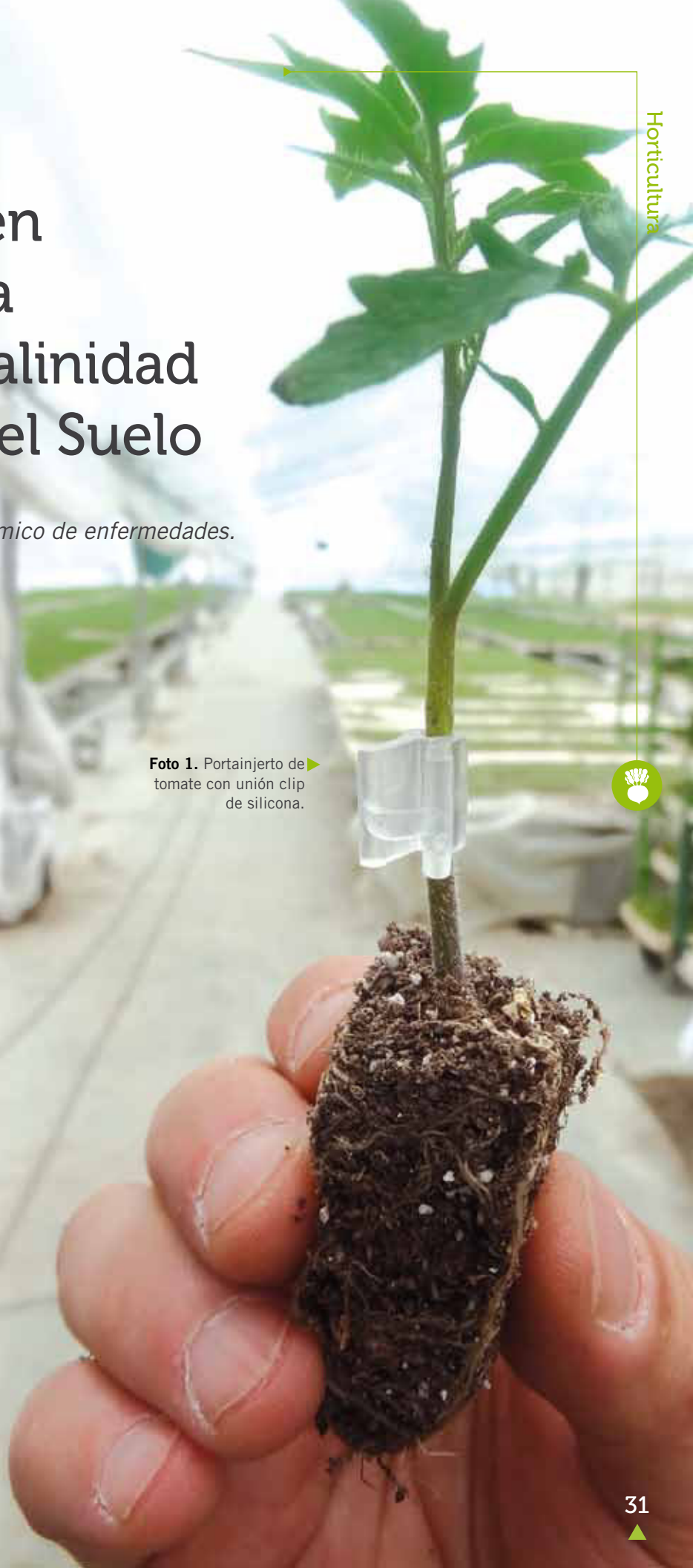
Foto 1. Portainjerto de tomate con unión clip de silicona.