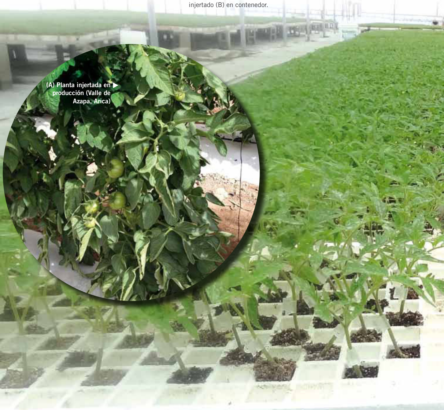
Foto 3. Plantines de tomate injertado (A) y no injertado (B) en contenedor.

En Chile, se cultivan alrededor de 13.000 hectáreas de tomate, que representan el 15% de las 90.000 hectáreas cultivadas comercialmente con hortalizas a nivel