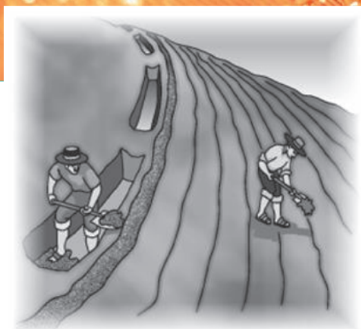
Figura 4. Realizando el mantenimiento de la zanja de infiltración.

En cada evento de lluvias, las zanjas de infiltración reciben tierra y restos de plantas, por lo cual se reduce su capacidad de acumulación, pudiendo llegar a no seguir haciéndolo. El material acumulado son sedimentos finos y arenas, con la mejor fertilidad del terreno; por lo cual al limpiar la zanja, los sedimentos acumulados se llevan nuevamente al terreno en las proximidades de las especies plantadas para aprovechar su fertilidad (Figura 4).