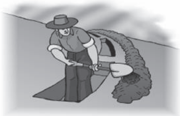
Figura 3. Depositando la tierra en la parte baja de la zanja, a unos 30 centímetros de distancia del borde de la zanja.

Etapa 3. La tierra que se saca de la zanja de infiltración debe depositarse en la parte baja de ella, formando un pequeño camellón para darle una sobre elevación. Se debe depositar la tierra no muy próxima a la zanja, en lo posible a unos 30 a 35 cm de distancia, para que la tierra no caiga nuevamente en ellas.