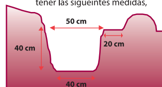
Figura 2. Construcción de zanjas

La zanja de infiltración terminada debe tener las siguientes medidas,