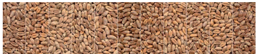
Foto 1. Grano de variedades certificadas cultivadas en La Araucanía

Las muestras son analizadas en el Laboratorio de Biotecnología de Plantas para validar la identidad de las muestras, y en el Laboratorio de Calidad de Trigos para determinar los parámetros de calidad: gluten húmedo, volumen de sedimentación.