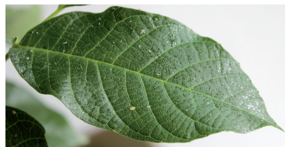
Foto 2. Mielecilla en hoja de nogal.