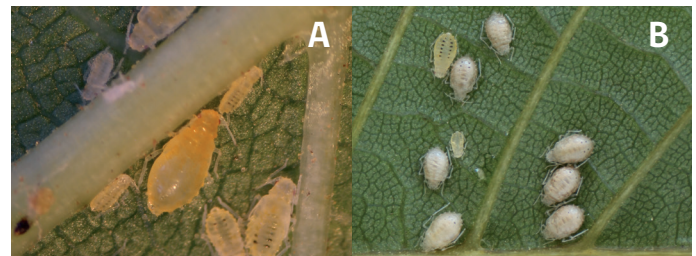
Foto 3. Pulgón del nogal A. Ninfa parasitada y B. Momias.