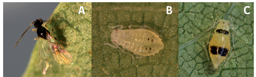
Foto 1. A. Parasitoide Trioxys pallidus ; B. Ninfa de IV estadio y C. Hembra adulta ovípara.

Durante el otoño y principalmente cuando se acerca la caída del follaje, la hembra vivípara alada comienza a generar machos y hembras ovíparas ápteras que se aparean para luego oviponer en rugosidades del tronco y ramas. Los huevos resisten las inclemencias invernales y en la primavera eclosionan las ninfas. Estas pasan por cinco estadios dando lugar a una nueva hembra fundatrix que corresponde a la forma de una hembra vivípara alada, que da origen a nuevas hembras vivíparas aladas que se reproducirán en forma asexuada.