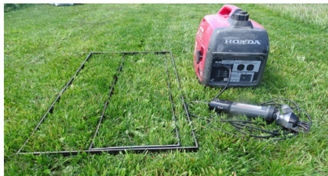
Figura 2. Equipo para el muestreo de con marco

El cálculo de la disponibilidad de forraje mediante un método directo de corte es el procedimiento más exacto y objetivo. Sin embargo, tiene la desventaja de requerir mucho tiempo tanto en la recolección de la muestra como en el secado de una submuestra para estimar MS. Para conocer otros métodos indirectos consulte las fichas técnicas INIA nº 15, 16 y 17.