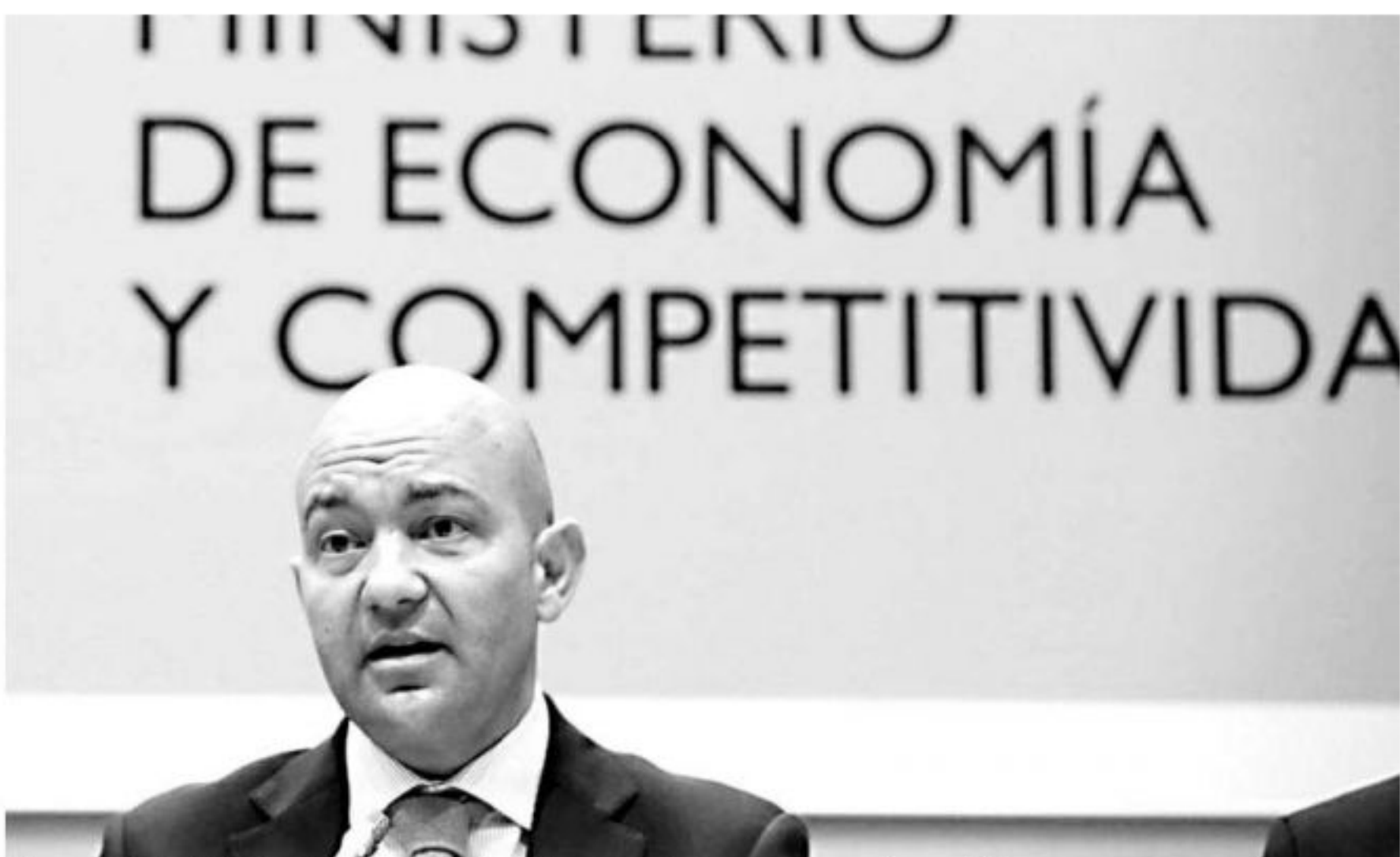
El secretario de Estado de Comercio, Jaime García-Legaz, presente en el foro.